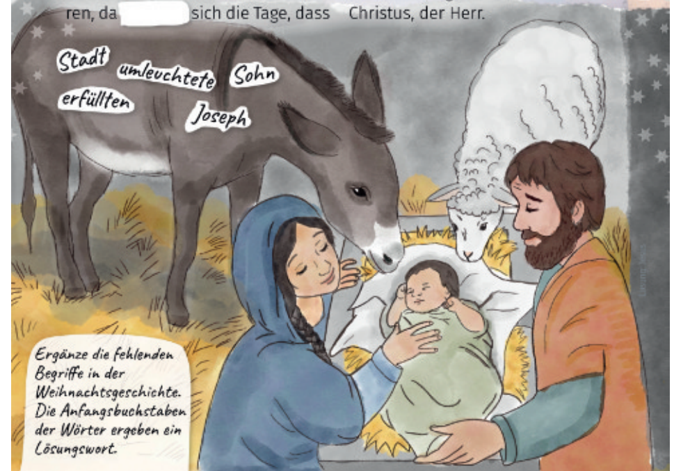
Rätsel: Wissen, Rätsel & Kreatives, Spielbox, © www.GewandhausGöttingen.de

sie gebären sollte. Und sie gebär ihren [ ], den Erstgeborenen, und wickelte ihn in Windeln und legte ihn in die Krippe, weil für sie kein Raum war in der Herberge. Und es waren Hirten in derselben Gegend auf dem Feld, die bewachten ihre Herde in der Nacht. Und siehe, ein Engel des Herrn trat zu ihnen, und die Herrlichkeit des Herrn [ ] sie; und sie fürchteten sich sehr. Und der Engel sprach zu ihnen: Fürchtet euch nicht! Denn siehe, ich verkündige euch große Freude, die dem ganzen Volk widerfahren soll. Denn euch ist heute in der [ ] Davids der Retter geboren, welcher ist Christus, der Herr.